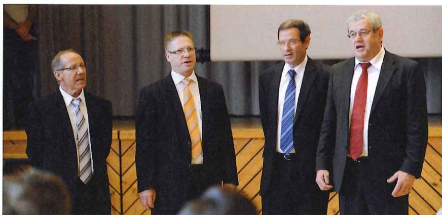
Feierliche Umrahmung der Jubiläumsfeier durch das «LIEDERMÄNNER Quartett Vocalis»